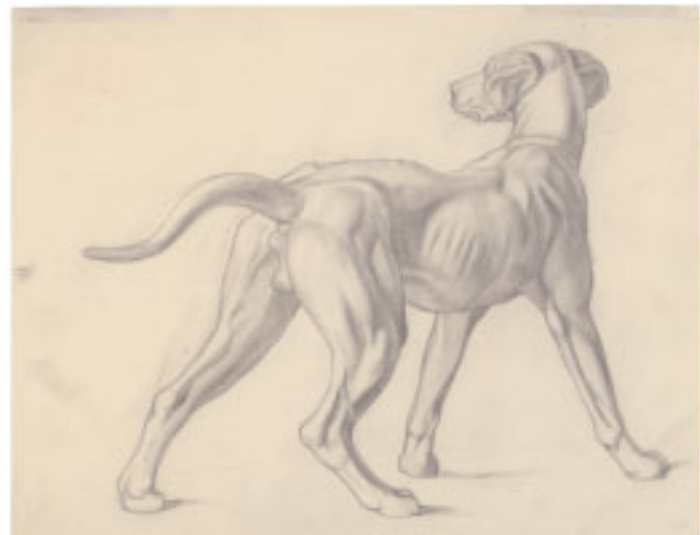
c) Stehender Hund, seitlich von hinten gesehen, 222 x 284 mm