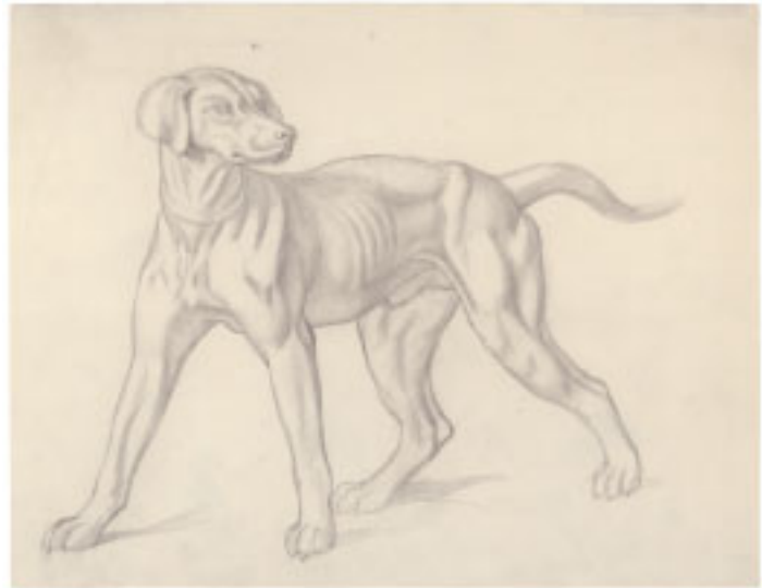
a) Stehender Hund, seitlich von vorne gesehen, 222 x 284 mm