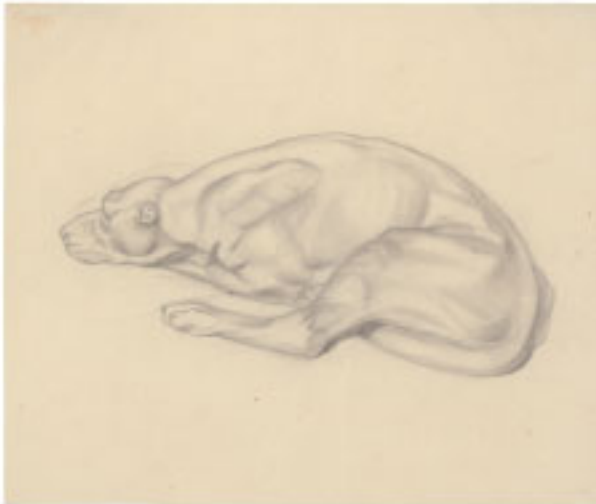
b) Liegender Hund, 207 x 246 mm